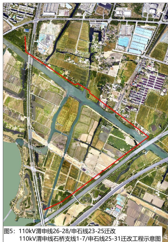
图5: 110kV 渭申线 26-28 / 申石线 23-25 迁改 110kV 渭申线 石桥支线 1-7 / 申石线 25-31 迁改工程示意图