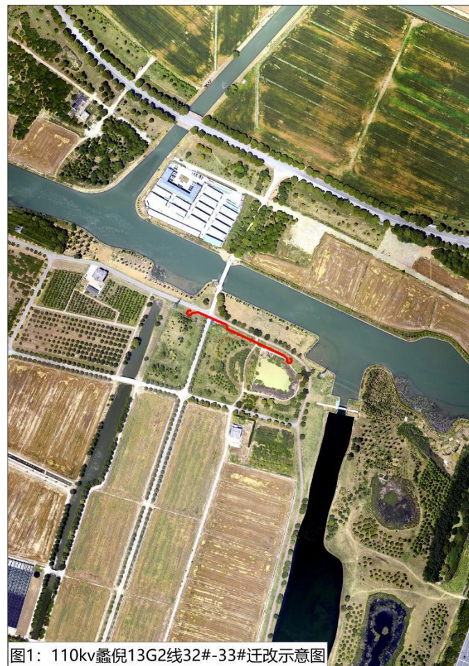
图1: 110kV 蠡倪 13G2 线 32#-33# 迁改示意图