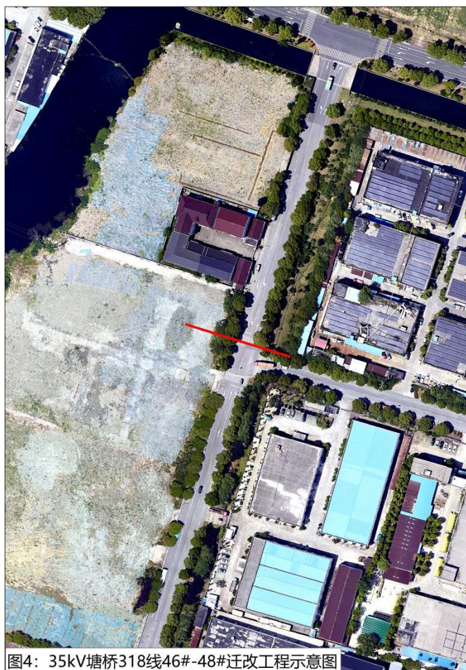
图4: 35kV 塘桥 318 线 46#-48# 迁改工程示意图