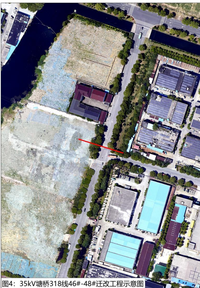
图4: 35kV 塘桥 318 线 46#-48# 迁改工程示意图