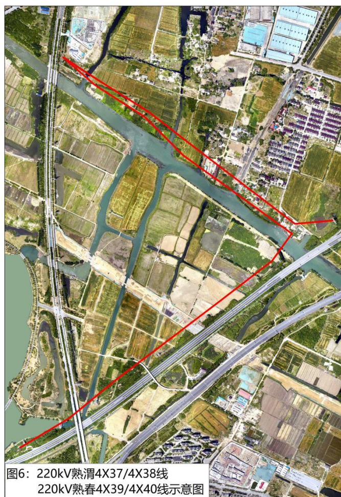
图6: 220kV 熟渭 4X37/4X38 线 220kV 熟春 4X39/4X40 线 迁改示意图