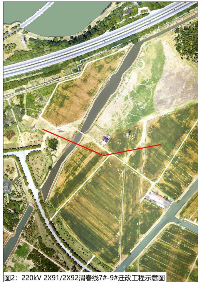
图2: 220kV 2X91/2X92 渭春线 7#-9# 迁改工程示意图